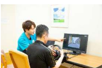
ドライブシミュレータ