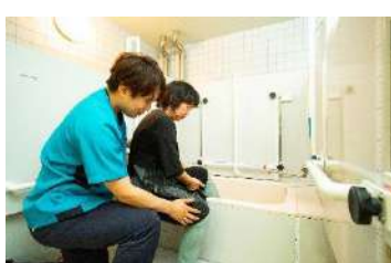
ユニバーサルルーム