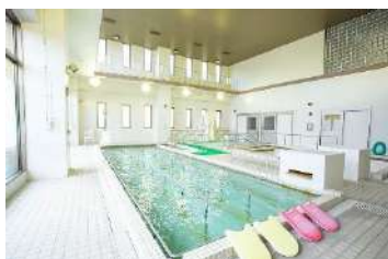
温泉水リハビリプール