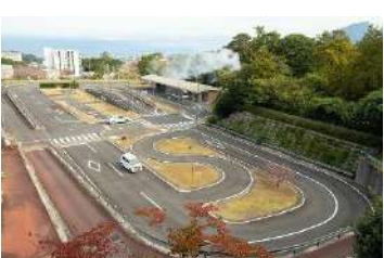
自動車運転コース