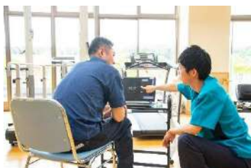
ダートフィッシュ